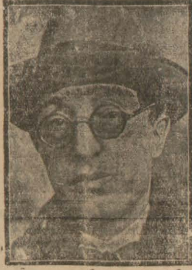
Dış İşler Bakanımız Bay Tevfik Rüştü Aras

ANKARA — Selâhiyettar bir kaynaktan alınan haberlere göre Türkiye Dış İşleri Bakanı Bay Tevfik Rüştü Aras, Cenevreye giderken Atina'ya uğrayacaktır. Bu görüşmeler, Ankarada konuşulan ekalliyetler işlerine inhisar ettirilmeyecek, Ankarada Türk - Yunan anlaşması hükümlerine ve bilhassa iki ülkenin müşterek müdafasına da teşmil edilecektir.